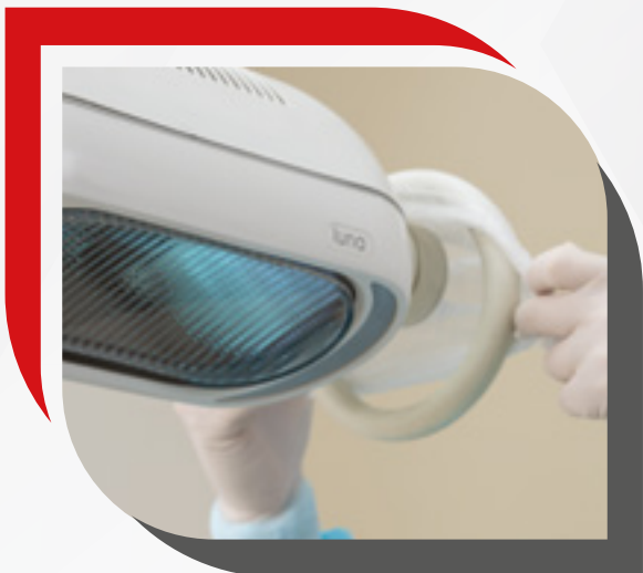
Aplicações das capas